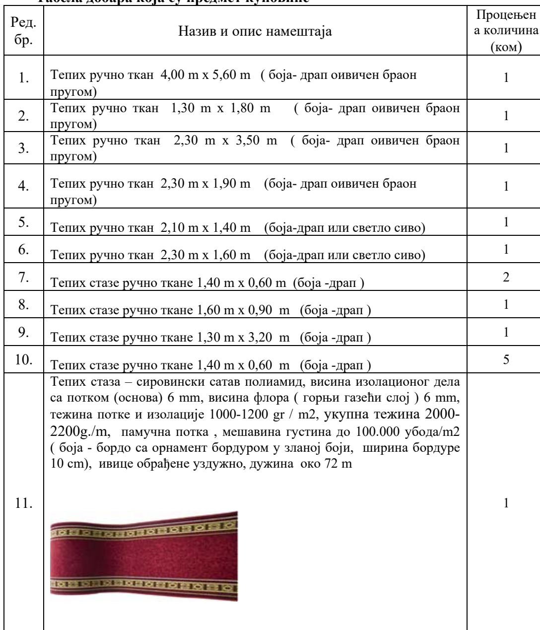
Табела добара која су предмет куповине

Технички опис (заједнички) од ред. број 1 до ред. бр.10- Ручно тафтовани теписи и стазе, ткани на памучној основи са 100% вуненом потком, 75000